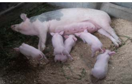
Porcs Ngoma, février 2012

C'est une entreprise héritière du Fonds Modeste et Innocent (FMIN) qui était une institution sans but lucratif. L'EEPVV est une entreprise privée à vocation sociale. En tant qu'entreprise privée, elle